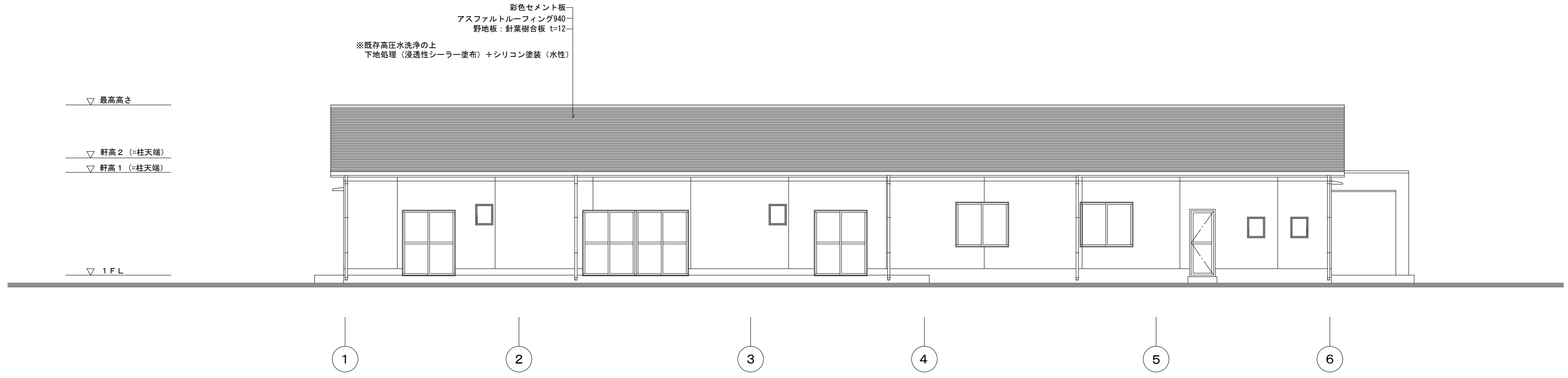
西 立面図 S=1/100